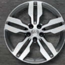
Leichtmetallfelgen 18" Archipel** zweifarbig