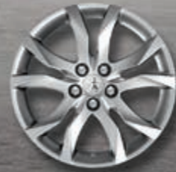
Leichtmetallfelgen 17" Style 05*