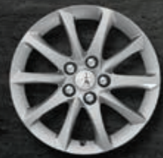
Leichtmetallfelgen 16" Style 01*