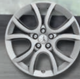
Leichtmetallfelgen 18" Style 07*