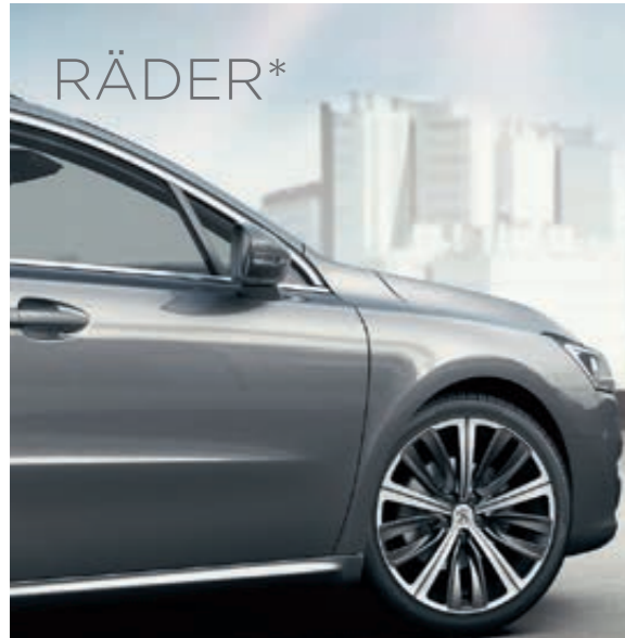
Leichtmetallfelgen 19" Style 12* zweifarbig