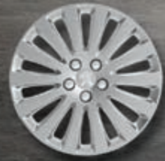
Radzierblenden 16" Style A*