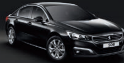
Perla Nera Schwarz