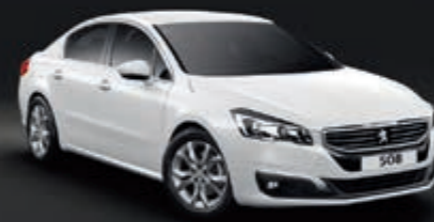
PERLEFFEKTLACKIERUNG – Perlmutter Weiß