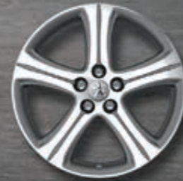
Leichtmetallfelgen 18" Style 10* zweifarbig