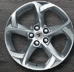
Leichtmetallfelgen 17" Style 06*