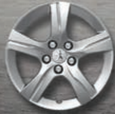
Leichtmetallfelgen 16" Style 02*