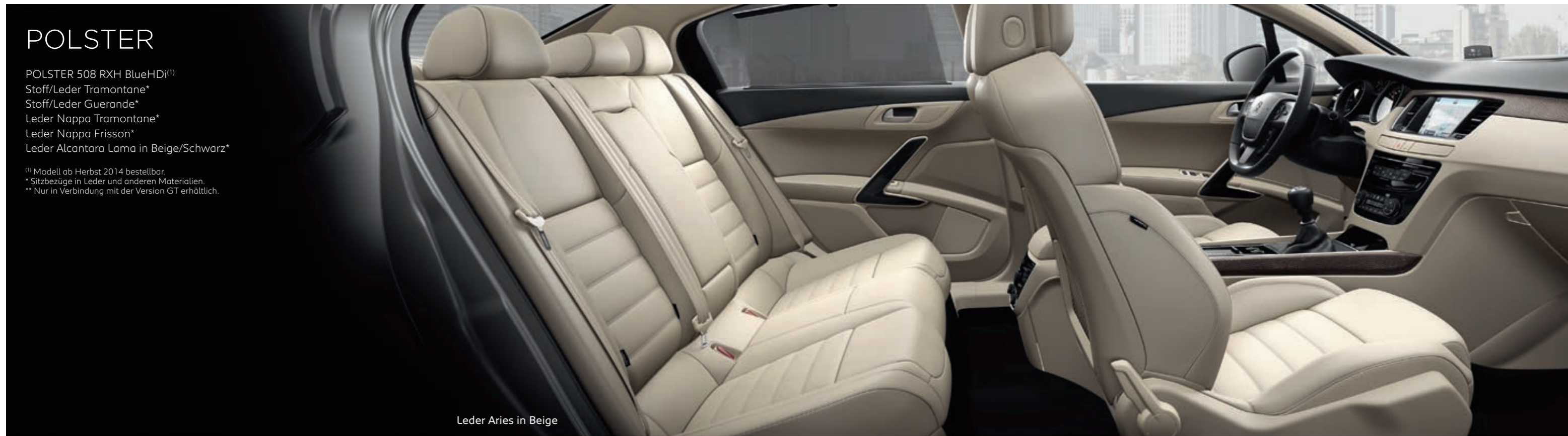
Leder Aries in Beige

** Nur in Verbindung mit der Version GT erhältlich.