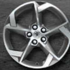
Leichtmetallfelgen 17" Style 11* zweifarbig