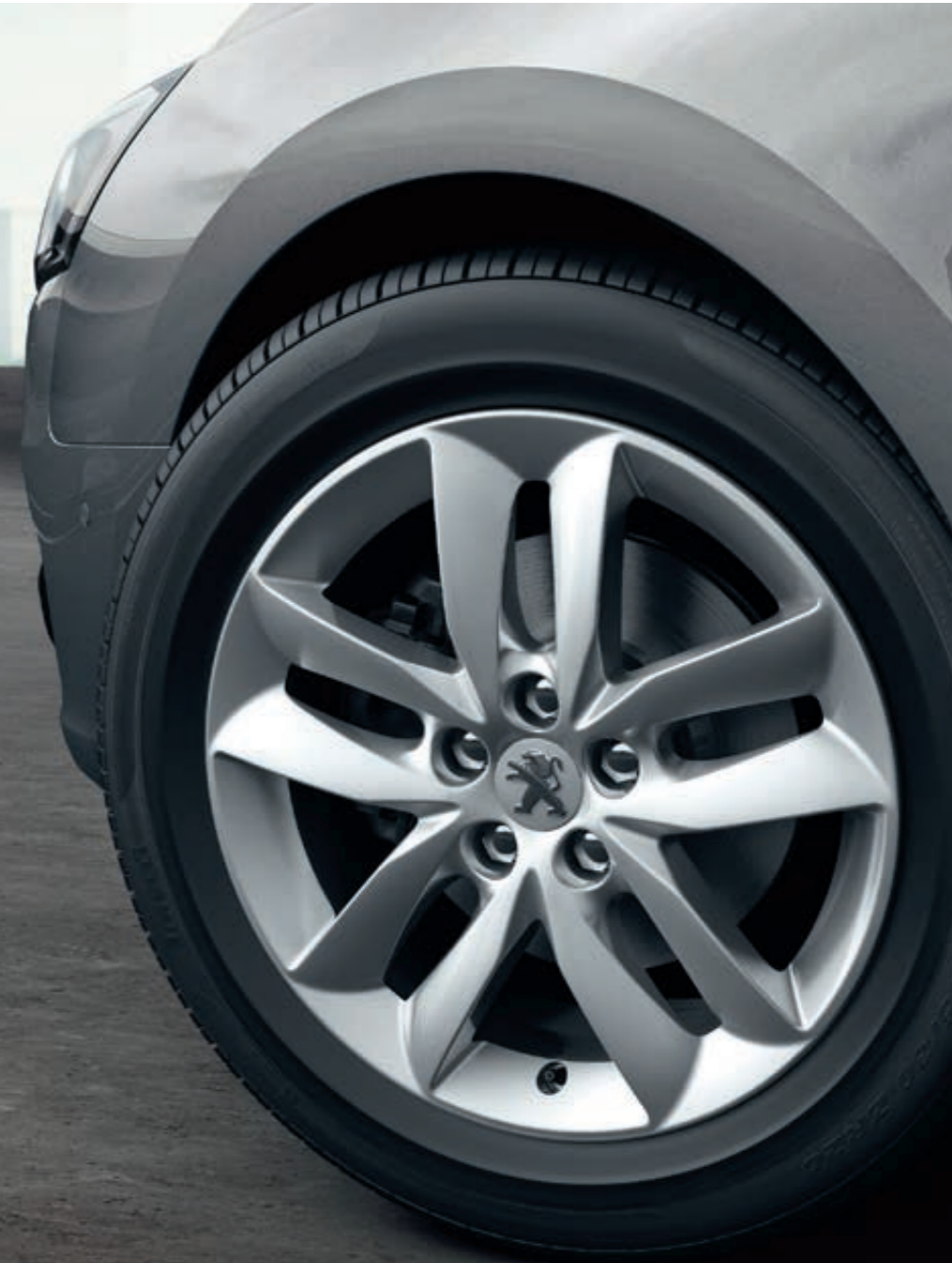
Leichtmetallfelgen 17" Style 04*